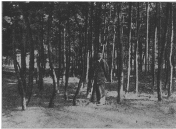
Abb. 1. Pfälzer × Märker 1928. (Aug. 1947.)

liche Provenienz einen Vorsprung erreicht, so daß von einer Heterosis nicht mehr gesprochen werden kann, es erfolgt ein Nachlassen der Hybriden, ähnlich wie ich es bei Hybriden zwischen japanischer und europäischer Lärchen beobachten konnte (s. diese Zeitschrift 1949 Heft 7 S. 192).