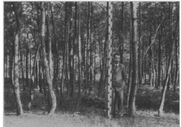
Abb. 2. Pfälzer × Pfälzer 1928. (Aug. 1947.)

Bezüglich des Brusthöhendurchmessers ist beim Versuch von 1929 deutlich die Gruppe mit stärkeren Durchmessern S × M, M × M und F × M, auch hier zeigt das Einkreuzen mit Märkerpollen deutlich eine Durchmesserzunahme.